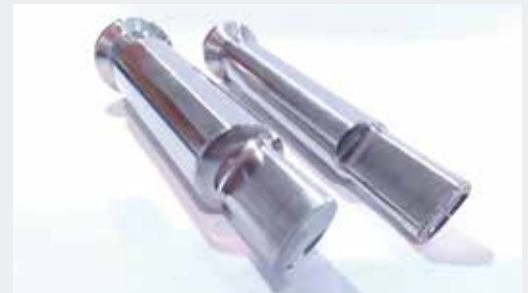
Punzones Especiales | Special Punches