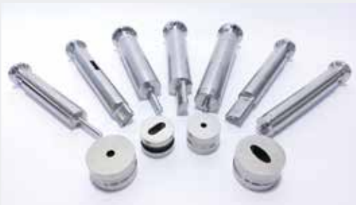
Punzones | Punches

Being the most recent incorporation to the group, they understand the needs of our customers and guarantee 100% of their products, with an unbeatable delivery time.