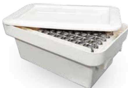
Caja de herramental | Tool storage box