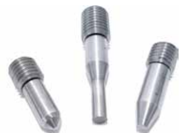
Traba matrices | Die lock screws