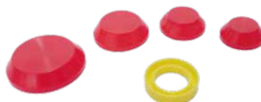
Tapas guardapolvo | Dust caps