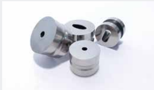
Matrices | Dies